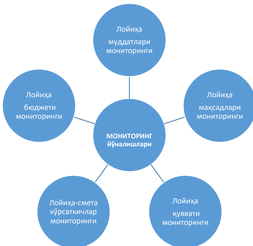
1-расм. Инвестиция лойиҳаси мониторингининг йўналишлари.

Бу эса мазкур ҳудудлар маҳаллий бошқарув органларини хорижий ҳамкорлар билан ишлашни, маҳаллий инфратузилмани такомиллаштиришни, ишлаб чиқариш учун шарт-шароитларни яхшилашни, инвестициялар жалб этиш борасида амалга оширилиши лозим бўлган ишларни янада ривожлантиришни талаб этади. Чунки давлат миқёсида хорижий инвесторлар учун барча шарт-шароитлар яратилган бўлиб, айниқса “Фаол инвестициялар ва ижтимоий ривожланиш йили” давлат дастурида [2] 2019 йил 1 мартдан бошлаб кўзда тутилган хорижий инвестициялар иштирокидаги корхоналар-нинг таъсисчилари ва уларнинг оила аъзолари учун муддатини мамлакатдан чиқмасдан узайтириш имконияти бўлган, амал қилиш муддати уч йилни ташкил қиладиган «инвестиция визаси» жорий этилиши, Ўзбекистон Респуб-ликаси ҳудудида товарлар ишлаб чиқариш ва хизматлар кўрсатиш бўйича корхоналар ташкил қилиш учун 3 миллион АҚШ долларида ортиқ миқдорда инвестиция киритган хорижий давлатлар фуқароларига яшаш гувоҳномаси 10 йил муддатга соддалаштирилган тартибда берилиши, Ўзбекистон Республикасида яшаш гувоҳномаси ёки «инвестиция визаси»га эга хорижий инвесторлар ҳамда уларнинг оила аъзолари Ўзбекистон Республикаси фуқаролари учун назарда тутилган шартларда тиббий ва таълим хизматларидан фойдаланиш ҳуқуқига эга бўлиши ва хорижий инвесторлар, улар томонидан хорижий давлатлар фуқаролари орасидан жалб этиладиган мутахассислар ва уларнинг оила аъзоларини вақтинча